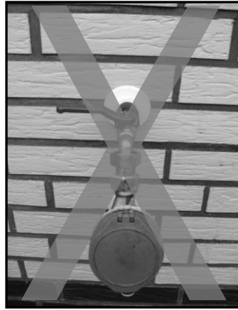
Nicht zulässige Installation eines Zwischenzählers