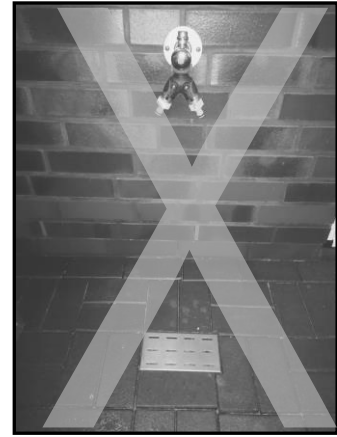
Nicht zulässiger Bodenablauf