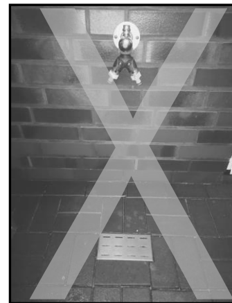
Nicht zulässiger Bodenablauf