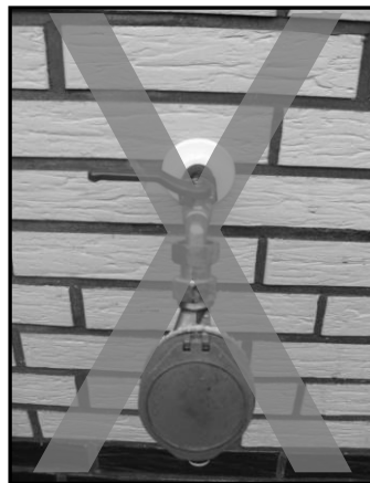
Nicht zulässige Installation eines Zwischenzählers